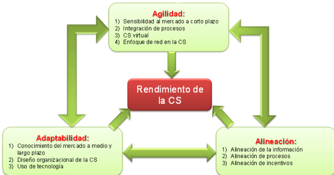
Figura 2. Relaciones de la triple A con el desempeño de la CS

Los resultados permitirían, entre otros, observar los pesos relativos de estas variables en cuanto a su incidencia en el rendimiento de la CS, así como determinar si es necesario que se den las tres para obtener los mayores rendimientos y para que éstos se mantengan a largo plazo. Para el estudio de la sostenibilidad será necesario el desarrollo de estudios longitudinales que permitan conocer el efecto que tienen estas variables a lo largo del tiempo.